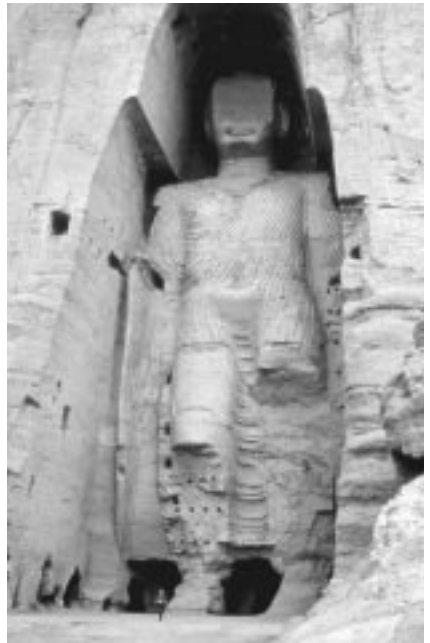
52 m Statue

Die Behauptung, dass es auf dem ganzen Globus keine größeren Statuen gibt, kann durch das Zeugnis aller Reisenden, die sie geprüft und vermessen haben, leicht geprüft werden. So ist die größte 52 Meter hoch oder 21 Meter höher als die 'Freiheitsstatue'. Selbst der berühmte Koloss von Rhodos, zwischen dessen Beinen die größten Schiffe jener Zeit mit Leichtigkeit hindurchfahren, war lediglich zwischen 36 und 39 Meter hoch. Die zweite Statue, welche wie die erste in den Felsen gehauen ist, misst lediglich 36 Meter (4,5 Meter höher als die erwähnte 'Freiheitsstatue') 1 . Die dritte Statue ist nur 18 Meter hoch – die beiden anderen