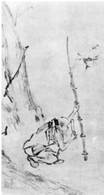
Hui-neng Bambus schneidend von Liang K'ai

Was Hui-neng störte, war die Behauptung, dass unser Denkvermögen Staub ansammelt und unentwegt rein gewaschen werden muss; für ihn ist unser Denkvermögen als Teil unserer spirituellen Natur immer rein und steht über den Täuschungen. Das formulierte er als Vers und bat einen Besucher, diesen an die Wand zu schreiben: