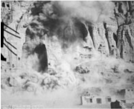
Zerstörung der 52 m hohen Statue, März 2001

vor Augen halten. Der große französische Philosoph sagt [aus einer modernen Übersetzung]: