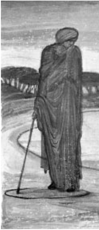
„Der magische Kreis“ (Detail) Edward Burne-Jones, ca. 1880