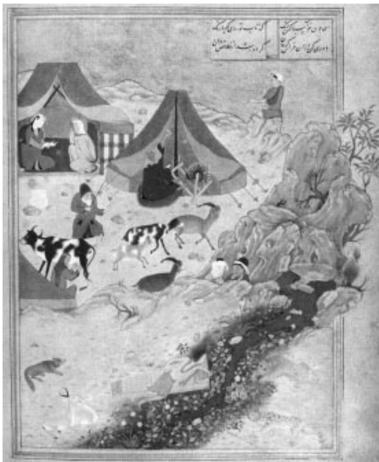
„Majnun stirbt an Laylas Grab“, Bihzad (ca. 1495)

Diese beiden Freunde sind eins, ewige Gefährten. Er ist Majnun, der König der Welt in richtigem Handeln. Und sie ist Layla, der Mond unter den Mitleidsidolen. In der Welt hüteten sie liebevoll wie ungeschliffene Rubine ihre Treue, fanden aber keine Ruhe und konnten das Verlangen ihres Herzens nicht erreichen. Hier leiden sie keinen Kummer mehr. So wird es in Ewigkeit sein. Wer immer in jener Welt das Leiden erträgt und erduldet, wird in dieser Welt voll Freude sein und erhöht werden.