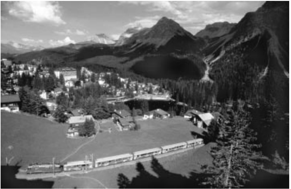
Die Erlebnisbahn bei Arosa

Arm war gelähmt, das rechte Bein schleppte er nach –, sprach mit einem Bekannten, und ich hörte ständig das Wort „Therapie ... Therapie ... Therapie ...“. Er konnte sie bestimmt brauchen und glaubte fest daran – und warum auch nicht!