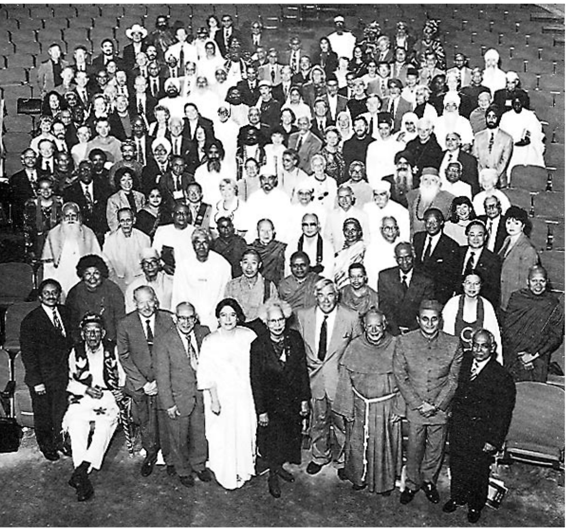
Versammlung der religiösen und spirituellen Leiter Samstag, 4. September 1993