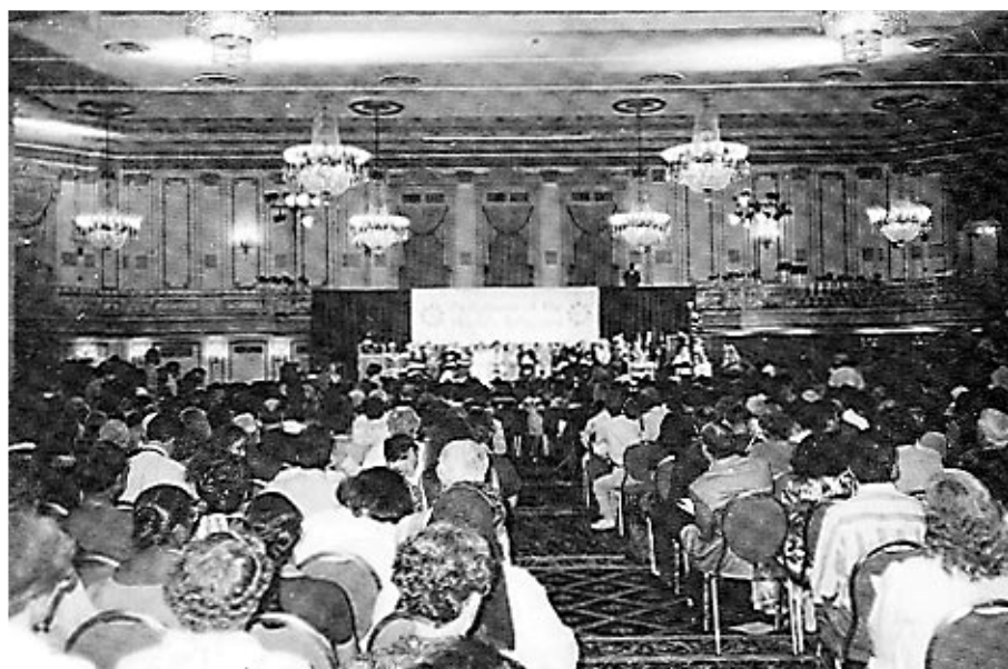
Eröffnungsveranstaltung, Palmer House Grand Ballroom Samstag, 28. August 1993, 14.30 Uhr