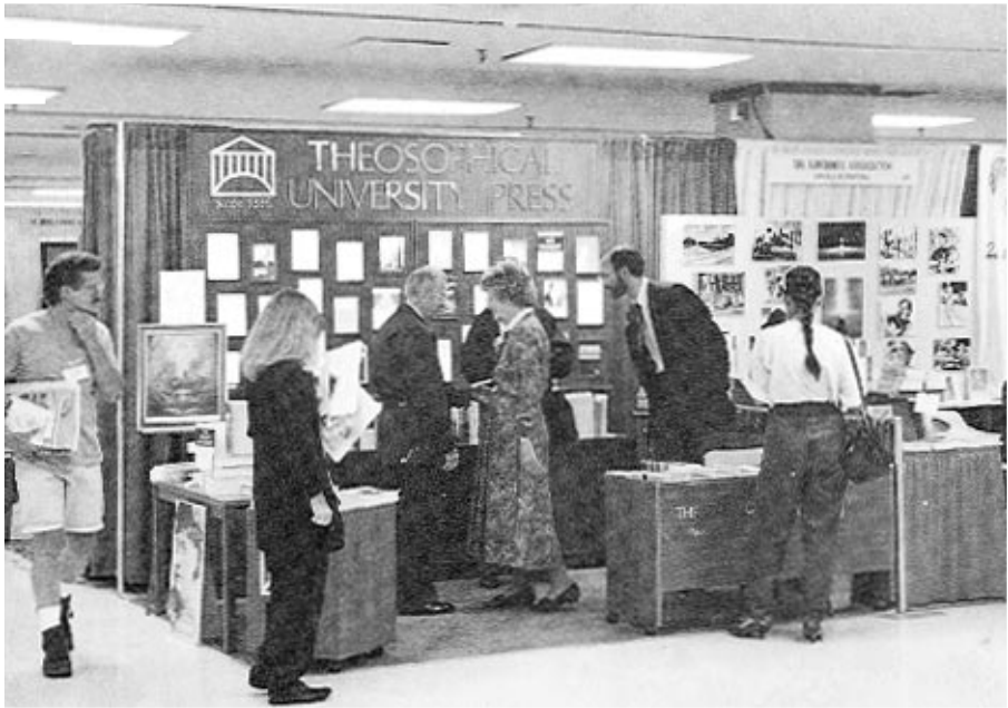
Stand der Theosophischen Gesellschaft/Theosophical University Press Palmer House Ausstellungshalle