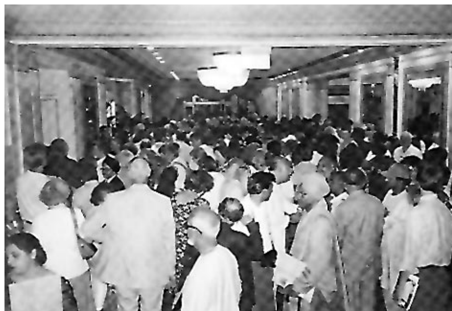
Foyer des Grand Ballroom, Palmer House