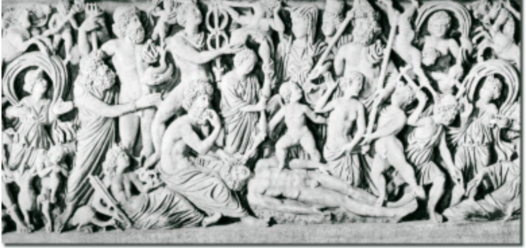
Von den olympischen Göttern umgeben bereitet Prometheus sich vor, den ersten Menschen zu beseelen.

für Erwachsene nicht angebracht und sogar gefährlich. Wir haben alle die Erzählung über Adam und Eva gehört, die von der Frucht des Baums der Erkenntnis von Gut und Böse gegessen haben und aus ihrem kindlichen Traumzustand aufwachten. Ich finde es fesselnd, dass das kein einmaliges Ereignis war: Wir fallen ständig in den Schlaf zurück, bewegen uns wie automatisch durch unsere Tage und müssen aus unserer Traumzeit wachgerüttelt werden – vielleicht liegt darin der wahre Wert, jeden Tag einen Apfel zu essen!