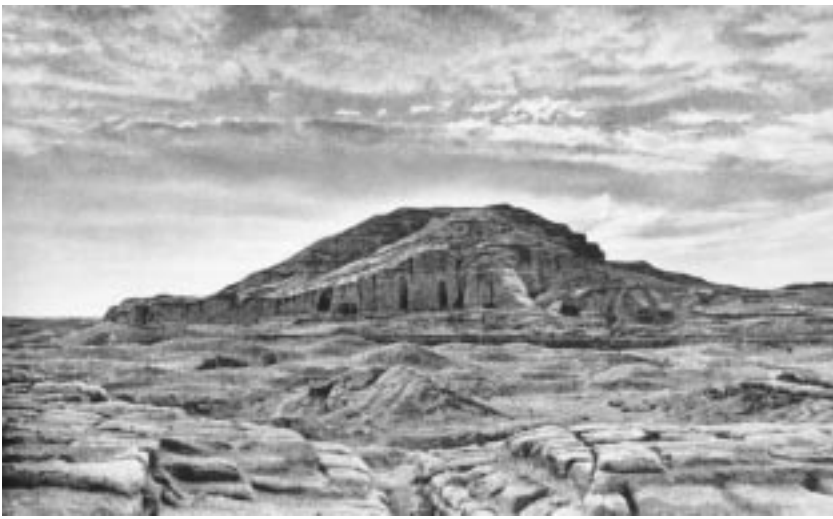
Ziggurat im Eanna-Sektor von Uruk

[Enkidu ist am Leben], haben viele Kommentatoren sie als einen Anhang angesehen. Zwar hat diese Behauptung ihr Gutes, aber der Inhalt und die Stelle in der Geschichte legt eine bewusste, symbolische Absicht nahe: Die Zwölf war numerisch und philosophisch wichtig für die Babylonier, da sie das Ende eines Zyklus und das Vorspiel des nächsten bezeichnete. In Übereinstimmung mit dem Thema der Wiederverkörperung ist Enkidu wieder einmal mit Gilgamesch vereint, obwohl er bald alleine in die Unterwelt absteigt, um zwei Gegenstände zurück zu holen, die Gilgamesch gehören und dort heruntergefallen sind. Das Thema der Unterwelt (was auch als eine Metapher für unsere Welt stehen kann) bezieht sich direkt auf Enkidus Todesvision am Beginn von Tafel 7, dem genauen Mittelpunkt der 12 Tafel-Version. Darüber hinaus enthält Tafel 12 nur ungefähr halb so viele Zeilen wie die anderen und endet abrupt, kein Text fehlt, nichts wird über die letzten Tage von Gilgamesch gesagt, die Geschichte ist unvollständig. Ein Gedicht unbekannter Herkunft in sumerischer Sprache, „Der Tod von Gilgamesch“, scheint in der 12 Tafel-Version mit Absicht ausgelassen zu sein, möglicherweise weil seine Betonung der Dauerhaftigkeit des Todes philosophisch nicht mit der hoffnungsvolleren Sichtweise des Epos übereinstimmte. Die 12. Tafel legt indes nahe – wenn auch zwischen den Zeilen –, dass wir das letzte Kapitel noch nicht gehört haben, sondern nur einen weiteren Wendepunkt im Lebenszyklus erreicht haben.