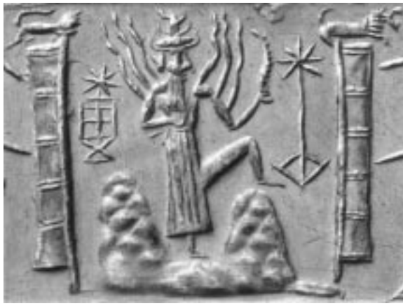
Shamash (die Sonne) zwischen Mashus Zwillingsgipfel arkadisch, 3. Jahrht. v. Chr. (Britisches Museum)

„Niemand hat das ein Sterblicher getan,“ sagte der Skorpionmann. „Niemand ist auf dem abgelegenen Bergpfad gewandert, denn man braucht zwölf Doppelstunden, 1 sein Zentrum zu erreichen; dicht ist die Finsternis und es gibt kein Licht.“ Gilgamesch konnte nicht abgehalten werden und befahl, dass das Tor geöffnet würde. Der Skorpionmann sprach zu König Gilgamesch, dem Fleisch der Götter: „Gehe in Sicherheit; das Tor steht Dir offen.“