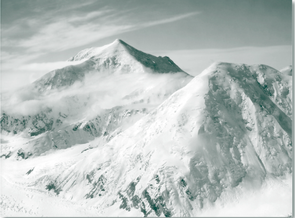
Mt. Foraker, Alaska