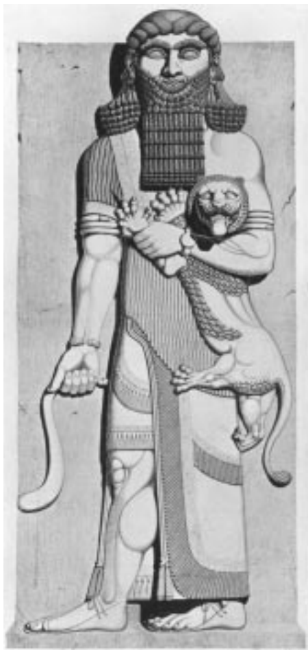
Gilgamesch, 8. Jahrhundert v. Chr. Palast von Sargon II, Khorsabad

Gilgamesch hatte zwei Träume, zuerst von einer Sternschnuppe, die auf ihn stürzte – sie war so schwer, dass er sie weder zu heben noch zu bewegen vermochte. Das Land von Uruk umschloss ihn. Die Menschen versammelten sich überall und Gilgamesch umarmte das Land wie eine Frau. Im zweiten Traum sah Gilgamesch eine Axt, die auf die Versammlung von Uruk fiel, und er drückte sie an sich, als wäre auch sie seine Frau. Verwirrt über deren Bedeutung ging er zu seiner Mutter, der weisen Göttin Ninsun, welche „die beiden Träume entwirrte“. Sie sagte ihm, dass sowohl der Himmelsstern als auch die Axt für seinen Gefährten stünden, der gerade kam. „Dieser Gefährte ist mächtig, hat furchteinflößende Stärke und ist imstande, einen Freund zu retten.“ Und doch fügte sie geheimnisvoll hinzu: „Er ist der eine, der dich [verlassen/retten] wird“ (die Tafel ist hier gebrochen und kann auf beide Arten gelesen werden).