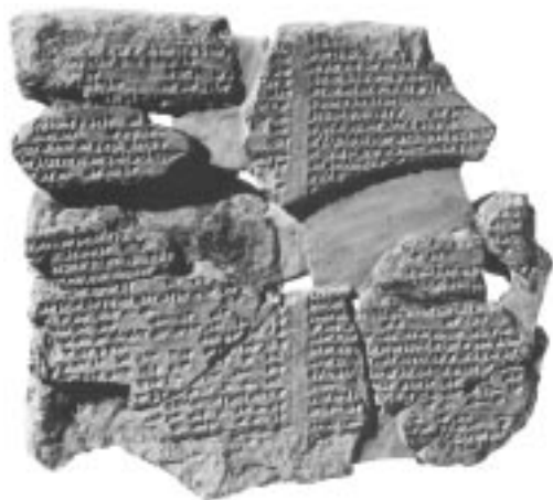
Fragment der Gilgamesch Tafel 11 (Britisches Museum)

Während nun Details der Erzählung oft abweichen, ist Gilgamesch ein Spiegelbild sowohl der Weltsicht der Sumerer als auch der Babylonier und Assyrer, die zuerst die Sumerer eroberten und dann ihre Kultur assimilierten. Wie alle Epen enthält Gilgamesch in all seinen Fassungen sowohl historische als auch mythologische Elemente und sollte deshalb auf verschiedenen Ebenen interpretiert werden. Neben seinen sehr menschlichen Themen wie Freundschaft, Mut, der Frage des Todes und dem Sinn des Lebens ist es auch eine Initiationsgeschichte über die Suche nach Erleuchtung, die Offenbarung der göttlichen Mysterien, die Dualität des Menschen und die evolutionäre Entfal-