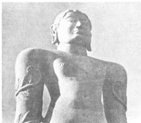
In Stein gehauene Kolossal-Statue von Gommat, Sohn des (1. Tīrthankara) Rishabhadeva.

Weitere Einblicke in die mystischen Lehren des Jainismus können durch das Studium ihrer komplizierten Lehren gewonnen werden. Sie glauben zum Beispiel, daß das allumfassende Leben aus einer unendlichen Anzahl sich gegenseitig beeinflussender Partikel zusammengesetzt ist. Jede Partikel ist essentiell ein jīva oder ein "Leben" – ein ewiges und individuelles Bewußtsein-Leben, das sich in von ihm selbst geschaffenen karmischen Vehikeln verkörpert. Während die jīvas von einem Atom, einem Menschen oder von einem Gott zwar fundamental rein, allwissend und harmonisch sind, sind sie dennoch sowohl durch ihre eigenen karmischen Beschränkungen als auch durch die karmischen Begrenzungen der Partikelgruppe graduell begrenzt, die die Körper aufbauen, in denen sie sich und durch die sie sich zu irgendeiner Zeit manifestieren.