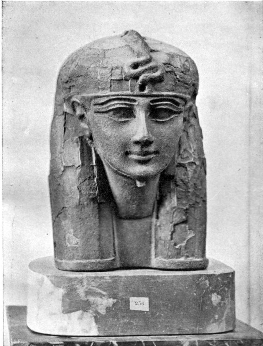
SKULPTUR DES KOPFES EINER ÄGYPTISCHEN KÖNIGIN NATIONAL MUSEUM, LOUVRE, PARIS