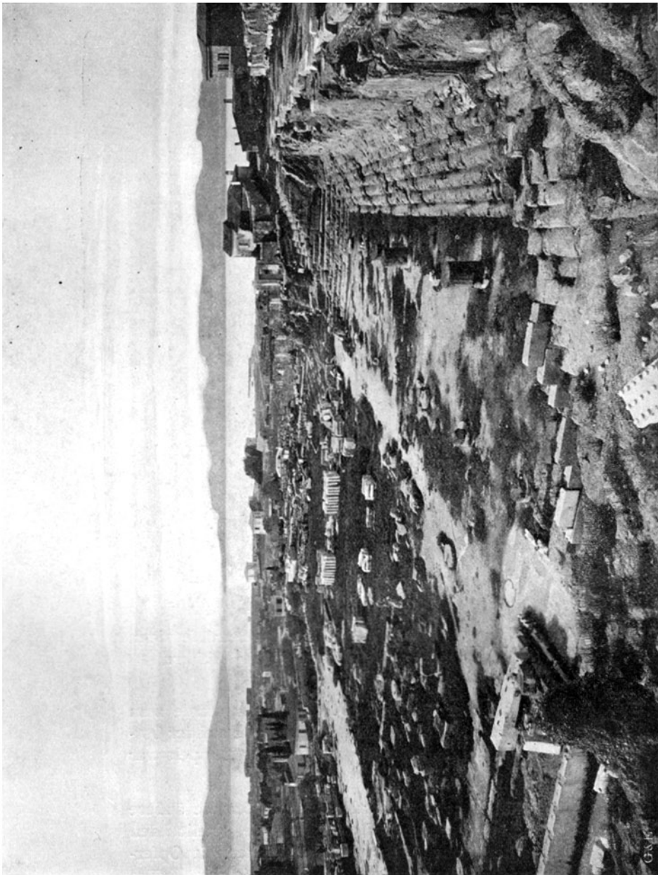
EIN TEIL DER RUINEN VON ELEUSIS